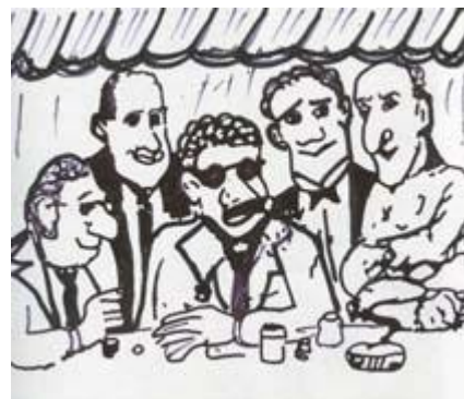
زرگران از شهرهای دیگر آمدند...

اگر برنامه‌هایشان به بیرون درز می‌کرد نقشه‌هایشان نقش بر آب می‌شد، در نتیجه بر سر اتحادی مخفیانه بین خود توافق کردند.