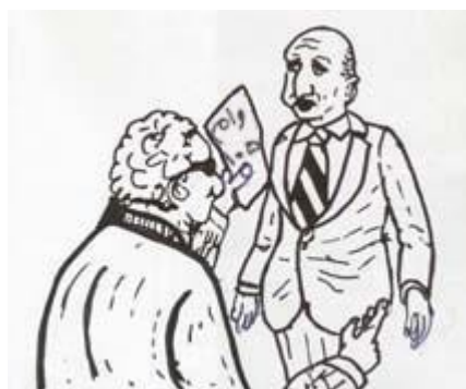
فابین به تمامی کسانی که مقروض بودند سر زد...

همین روند توسط بناهای ساختمان، متصدی‌های حمل و نقل، حسابداران، کشاورزان و درواقع تمامی کسانی که خدماتی ارائه می‌کردند در پیش گرفته شد. مشتریان همیشه چیزی را انتخاب می‌کردند که فکر می‌کردند معامله‌ی بهتری است، آنها حق انتخاب داشتند. حمایت‌های ساختگی مانند جواز یا تعرفه وجود نداشت تا مانع ورود دیگر مردمان به تجارت شود. استانداردهای زندگی بالا رفت و پس از مدت کوتاهی مردم دیگر زندگی بدون پول را نمی‌توانستند تصور کنند.