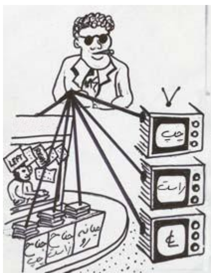
برای این‌کار فابین اکثر روزنامه‌ها، تلویزیون و ایستگاه‌های رادیویی را خریداری کرد...

در یکی از شهرها بهره‌ی بدهی‌ها از مقدار پولی که سالانه جمع می‌شد تجاوز کرد. در تمام کشور بهره‌های پرداخت‌نشده افزایش می‌یافت - به بهره‌های پرداخت نشده نیز بهره تعلق می‌گرفت. بتدریج اکثر دارائی‌های واقعی کشور تحت مالکیت یا کنترل فابین و دوستانش درآمد و همراه با آن کنترل بر روی مردم شدت یافت. با این حال قدرت و کنترل آنها هنوز کامل نبود. آنان می‌دانستند که وضعیت پایدار و امن نخواهد بود مگر اینکه تک تک افراد تحت کنترل باشند.