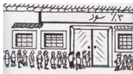
قسمت دوم نقشه فابین آغاز شد...

اغلب مردم باور داشتند که فابین پولشان را با بهره ۵٪ به قرض‌کنندگان وام می‌دهد و سود او تفاوت ۲ درصدی میان سود حسابداران و بهره‌ی