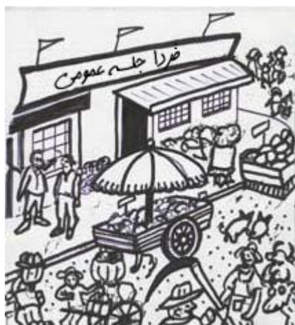
بازار همیشه شلوغ و پرگرد و خاک بود...

روز تشکیل بازار همیشه شلوغ و پر گرد و خاک بود با این حال مردم با اشتیاق منتظر فریاد زدن‌ها و جنب و جوش و خصوصا هم‌صحبتی در آن می‌ماندند. اینجا معمولا مکان شادی بود اما حالا مردم بسیاری جمع می‌شدند و جر و بحث‌های زیادی صورت می‌گرفت. دیگر زمانی برای گپ‌زدن باقی نمانده بود... سیستم بهتری مورد نیاز بود.