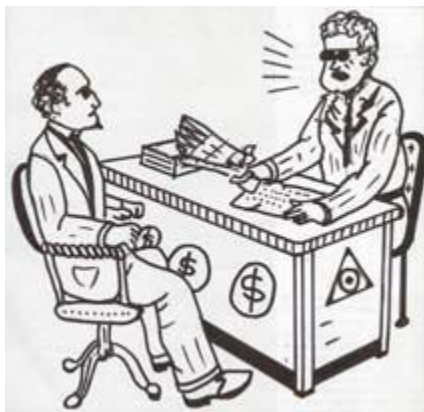
اقتصاد مالی موضوع پیچیده‌ای است پسر

بله، آنها پولی سکه نمی‌زدند، دولت اسکناس‌ها و سکه‌ها را چاپ و ضرب کرده و به زرگران می‌داد تا توزیع کنند. تنها هزینه‌ای که فابین می‌پرداخت دستمزد ناچیز چاپ بود. با این حال آنان پول اعتباری بدون هیچ پشتوانه‌ای آفریده و بر روی آن سود مطالبه می‌کردند. اکثر مردم فکر می‌کردند موجودی پول توسط دولت تامین می‌شود. همچنین تصور می‌کردند که فابین از سپرده‌ی شخص دیگری به آنها وام می‌دهد اما بسیار عجیب بود که هنگام پرداخت وام، سپرده‌ی هیچ‌کس کاهش نمی‌یافت. اگر همه در آن واحد سپرده حساب‌هایشان را بیرون می‌کشیدند، کلاهبرداری عیان می‌شد. هنگامی که وامی بصورت اسکناس یا سکه تقاضا می‌شد هیچ مشکلی ایجاد نمی‌کرد. فابین صرفا به دولت توضیح می‌داد که افزایش جمعیت و تولیدات نیازمند اسکناس بیشتر است و بدین ترتیب پول‌ها را به ازای هزینه‌ی ناچیز چاپ به دست می‌آورد.