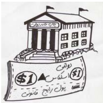
دولت وظیفه‌ی چاپ رسیدهای جدیدی را بر عهده بگیرد...

روز بعد آنان جلسه‌ای با تمامی دولتمردان برپا کردند و فابین چنین آغاز کرد: «رسیده‌هایی که ما صادر می‌کنیم بسیار معمول شده است. شکی نیست که اغلب شما دولتمردان نیز از آنها استفاده کرده‌اید و راحت و مناسب یافته‌اید.» دولتمردان سری به تأیید تکان داده و به فکر فرو رفتند که مشکل کجاست. فابین ادامه داد: «خب. برخی از این رسیدها توسط جاعلین نسخه‌برداری شده است. این روش بایستی متوقف شود.»