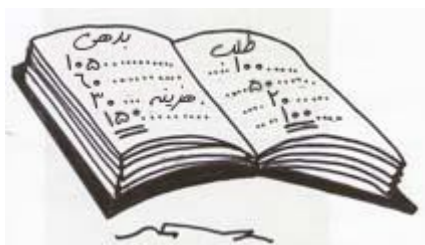
دفتری داشت که بدهی و طلب را در آن یادداشت می‌کرد

دوستان، غریبه‌ها و حتی دشمنان برای اداره کسب و کار خود به سرمایه نیاز داشتند و تا زمانی که قادر بودند بازپرداخت آن را تضمین کنند می‌توانستند به هر مقدار که نیاز دارند قرض بگیرند. فابین خیلی ساده با پر کردن رسیدها قادر بود چندین برابر ارزش طلا در گاوصندوقش وام بدهد، درحالی که حتی مالکشان هم نبود. مادامی که مالکین واقعی طلاهایشان را در خواست نمی‌کردند و اعتماد مردم سلب نمی‌شد همه چیز درست بود.