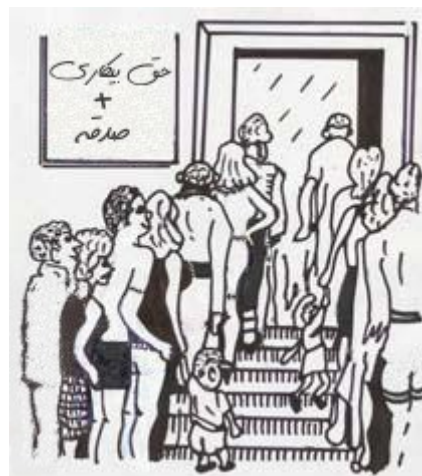
آنها برنامه‌های رفاه اجتماعی را آغاز کردند...

اما همه احساس درماندگی کرده و از حکم زندان واهمه داشتند که برای ترساندن مردم از پرداخت نکردن تعیین شده بود. این برنامه‌ها تا حدی تسکین‌بخش بود اما طولی نگذشته مشکل به خانه‌ی اول بازگشت و پول بیشتری برای فایق آمدن بر فقر مورد نیاز بود. هزینه آن طرح‌ها بالا و بالاتر رفت و دولت بزرگ‌تر شد.