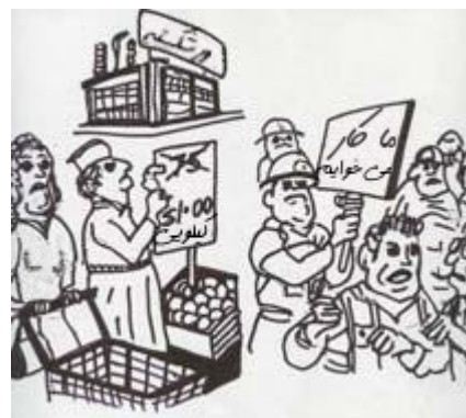
با بدتر شدن اوضاع...

با بدتر شدن اوضاع دولتمردان روش‌هایی همچون کنترل مزد، کنترل قیمت و انواع مختلف کنترل‌ها را آزمودند. دولت سعی داشت پول بیشتری از طریق مالیات بر فروش، مالیات بر حقوق و تمامی انواع مالیات‌ها به دست بیاورد. کسی حساب کرده بود تا رسیدن یک قرص نان به دست مصرف‌کننده، ۵۰ مورد مالیات مختلف شامل آن می‌شد.