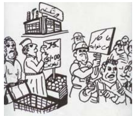
بالاخره برخی از مردم به اعتصاب پرداختند

سرانجام برخی از مردم دست به اعتصاب زدند، حرکتی که تا آن زمان سابقه نداشت. عده‌ی بسیاری نیز دچار مصیبت تنگ‌دستی شدند و دوستان و اطرافیانشان توان کمک به آنها را نداشتند. اکثر افراد ثروت واقعی را که همه جا بود فراموش کرده بودند: خاک حاصلخیز، جنگل‌های انبوه، معادن و احشام. آنان فقط به پول فکر می‌کردند که همیشه کمیاب و اندک بود. اما هیچ‌وقت درباره سیستم سؤالی نمی‌پرسیدند. آنها تصور می‌کردند که دولت سیستم را اداره می‌کند.