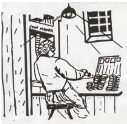
فابین وقت را هدر نداد...

راه دیگری وجود نداشت و جدای از آن ۵٪ به نظر هزینه‌ی اندکی می‌آمد. «جمعه‌ی بعد بازگردید تا شروع کنیم.»