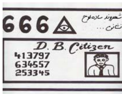
تشکیلات او به هرکس یک کارت پلاستیکی کوچک عرضه کرد...

یکبار دیگر فابین پاسخ را در آستین داشت. تشکیلات او به هرکس یک کارت پلاستیکی کوچک عرضه می‌کرد که بر رویش اسم فرد، عکس و شماره شناسایی‌اش حک شده بود.