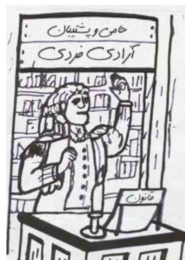
این تنها و یگانه وظیفه دولت بود...

با این حال بازار تنها مشکلی بود که آنان نمی‌توانستند حلش کنند. یک چاقو به یک سبد ذرت می‌ارزید یا دو سبد؟ یک گاو بیشتر از یک ارابه می‌ارزید؟ و مسائلی از این دست... هیچ‌کس نتوانسته بود سیستم بهتری بیابد.