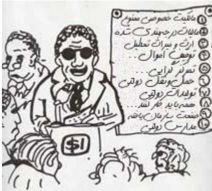
یک سیستم مالیاتی تعریف شد

هیچ مجال و فضایی برای ابتکار فردی وجود نداشت، از تلاش‌هایشان تقدیری نمی‌شد، درآمدها مقدار ثابتی بود و ترفیع رتبه زمانی اعطا می‌شد که مافوقی بازنشسته می‌شد یا از دنیا می‌رفت.