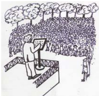
روز بعد مردم زیادی جمع شدند...

او شرح داد که قیمت‌ها چگونه عمل خواهند کرد و اینکه «پول» واسطه‌ای برای مبادله خواهد بود، یک سیستم به مراتب بهتر از معامله‌ی کالا به کالا.