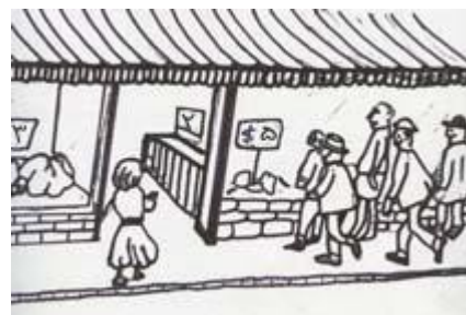
این اصل رقابت آزاد بود...

بعد شخص دیگری شروع به ساختن ساعت کرد و برای اینکه آنها را بفروشد به قیمت کمتری عرضه کرد. آلن مجبور شد قیمت‌هایش را پایین بیاورد، و در مدت کوتاهی قیمت‌ها کاهش یافتند بطوری که هر دو ساعت‌ساز بر سر عرضه محصولی با کیفیت بهتر و قیمت کمتر با یکدیگر به رقابت می‌پرداختند. این اصل رقابت آزاد بود.